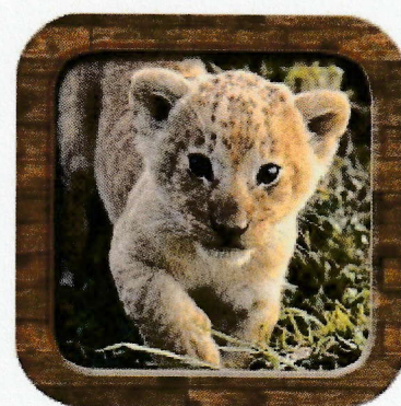
Cris d'animaux Disponible sur Google play store et App store