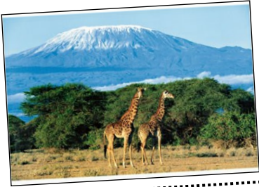
les girafes du Kilimandjaro