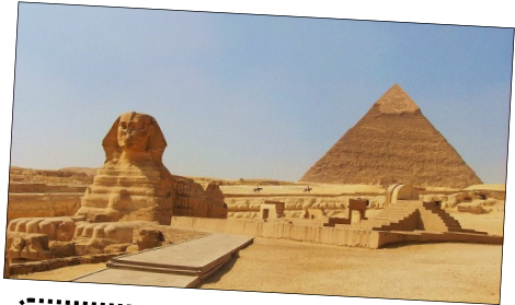
les pyramides d'Egypte