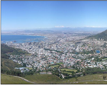
Le Cap (Afrique du Sud)