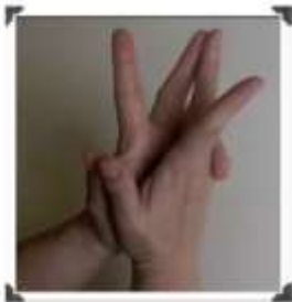
Le bravo des doigts