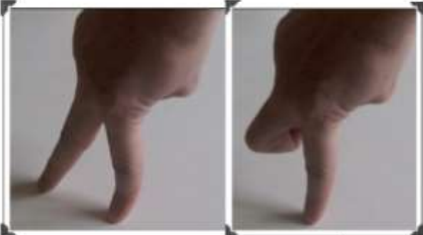
La gym des jambes