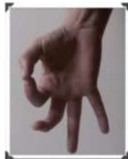
Le bonjour du pouce