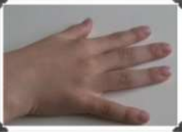
Le piano plat