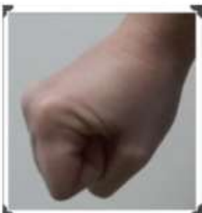
Le poing ouvert et fermé